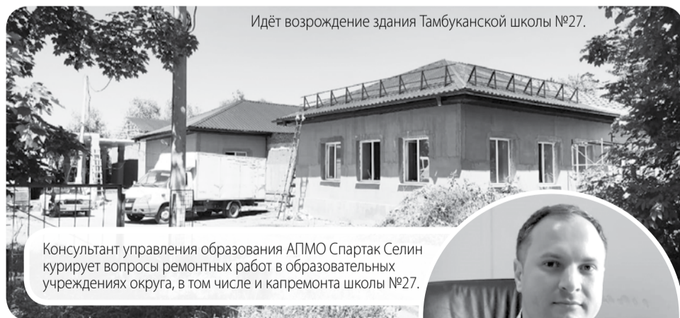
Идёт возрождение здания Тамбуканской школы №27.

Консультант управления образования АПМО Спартак Селин курирует вопросы ремонтных работ в образовательных учреждениях округа, в том числе и капремонта школы №27.