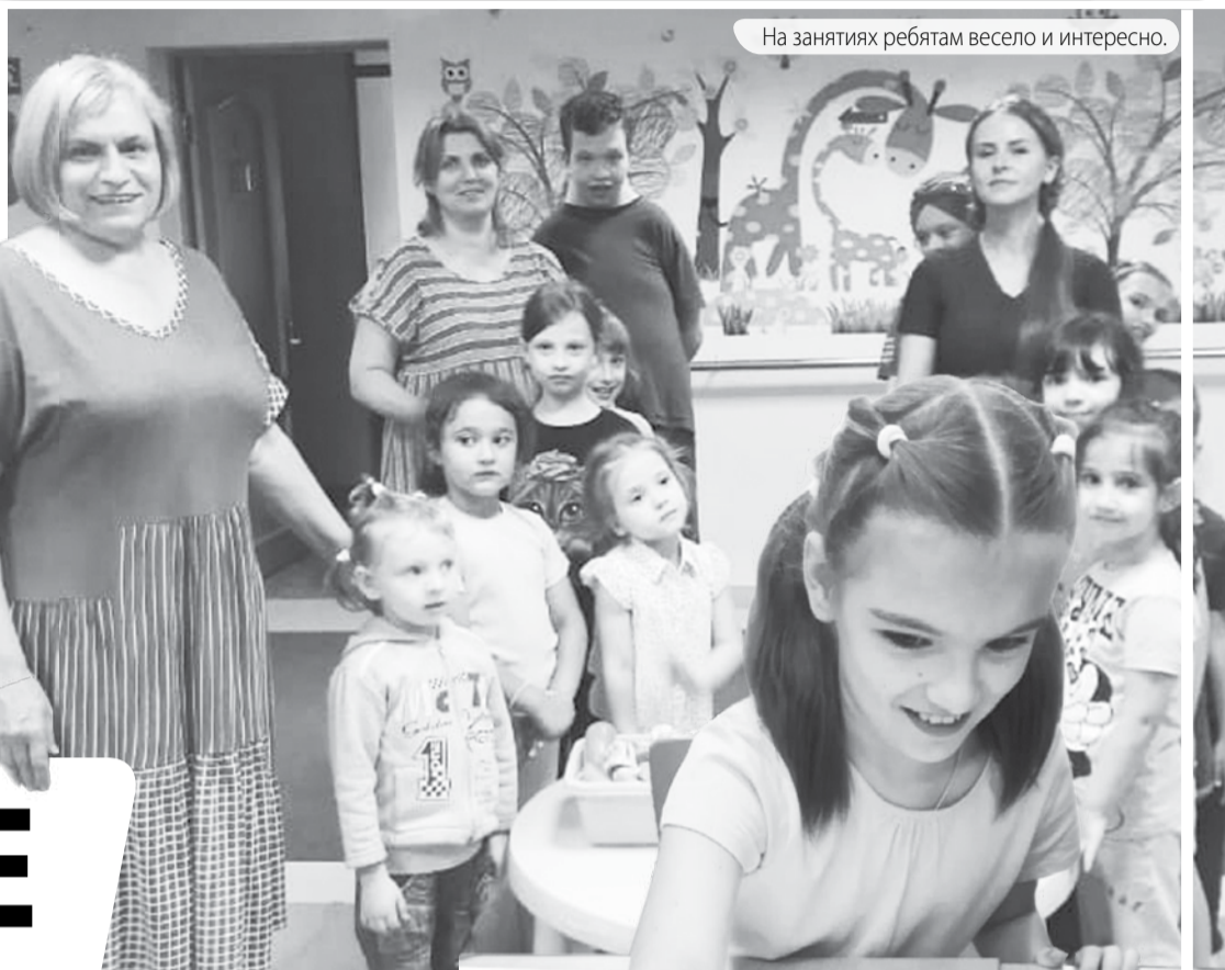
На занятиях ребятам весело и интересно.