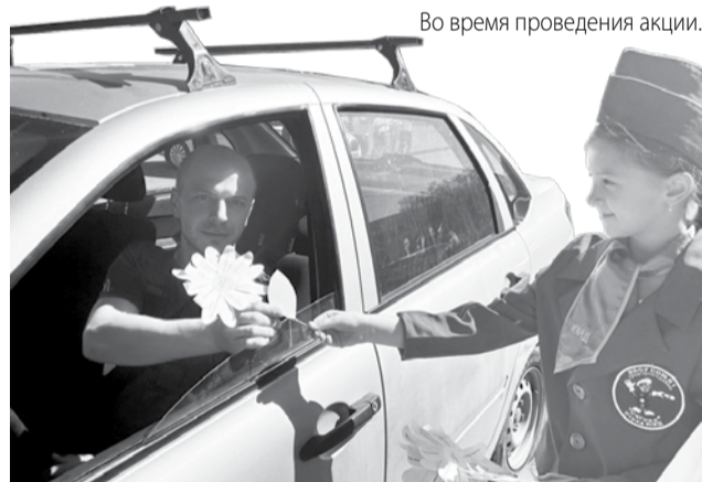
Во время проведения акции.

Текст и фото ОГИБДД ОМВД России «Предгорный».