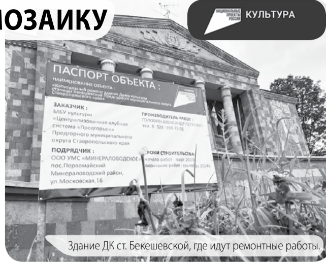
Здание ДК ст. Бекешевской, где идут ремонтные работы.